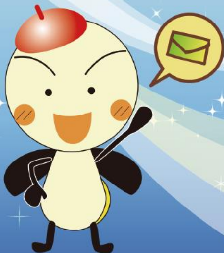
守山市PRキャラクター「もーりー」

守山市では、市民の皆様が安全で安心な生活を過ごせるために、 災害、気象、行政、地震、防犯に関する各種情報を メール機能を利用し配信しています！ 登録は無料ですので、是非ご活用ください。